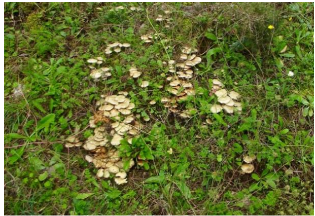
A sx: il Bosco di Aglisotto. A dx: famiglia di funghi.