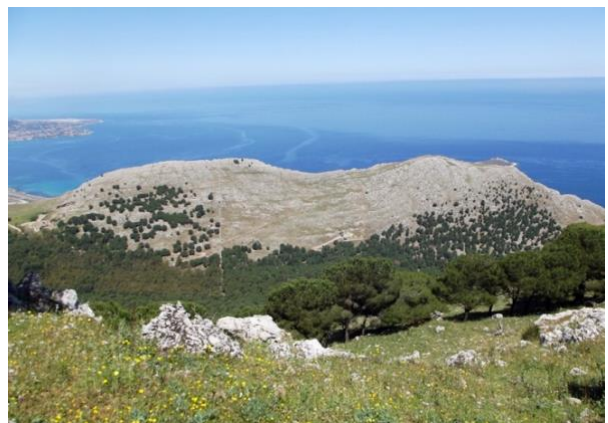
A sx: boschi del Demanio Billiemi. A dx: paesaggio col Monte Raffo Rosso.