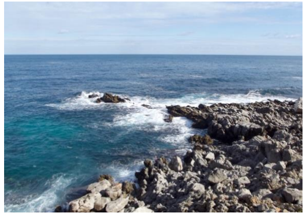
A sx: Capo Gallo e il suo faro. A dx la scogliera.