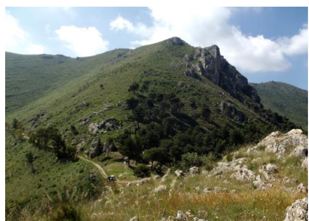
A sx, panorama su Palermo; a dx Pizzo Orecchiuta, col Balzo Rosso.

Iniziamo quindi la passeggiata a piedi, percorrendo un breve sentiero roccioso che ci porta subito sulla sommità del Monte Starrabba. Ci troviamo su un belvedere naturale fra i migliori per poter ammirare la Conca d'Oro. Alla nostra vista si apre verso N, la Pianura Palermitana con in fondo i 2 Promontori di Monte Pellegrino e Monte Gallo; da NO ad O il versante orientale dei Monti di Billiemi e dei Monti di Monreale; ad O e SO la Valle dell'Oreto; mentre volgendo lo sguardo a S e ad E si osserva il gruppo montuoso su cui ci troviamo, con il Monte Orecchiuta, sul cui versante spicca l'alta parete del Balzo Rosso; il fronte settentrionale dei Monti di Belmonte Mezzagno (Serro Chiarandà) con lo sperone del Balzo Cavallo, ad E.