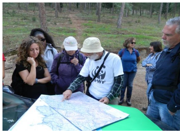
In attesa dei pulmini forestali, si illustra la geografia della Conca d'Oro.

Chi si trova già a bordo degli automezzi forestali può proseguire per la meta della nostra passeggiata, il Monte Starrabba; mentre un gruppetto di una decina, giunto con le proprie autovetture, rimane ad aspettare il loro ritorno, e viene intrattenuto con la descrizione geografica del sito.