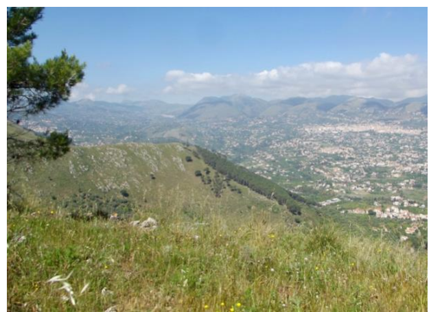
Panorami con vista di Monreale e della Valle dell'Oreto.