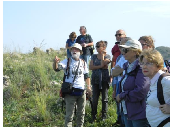
Si osserva il panorama.