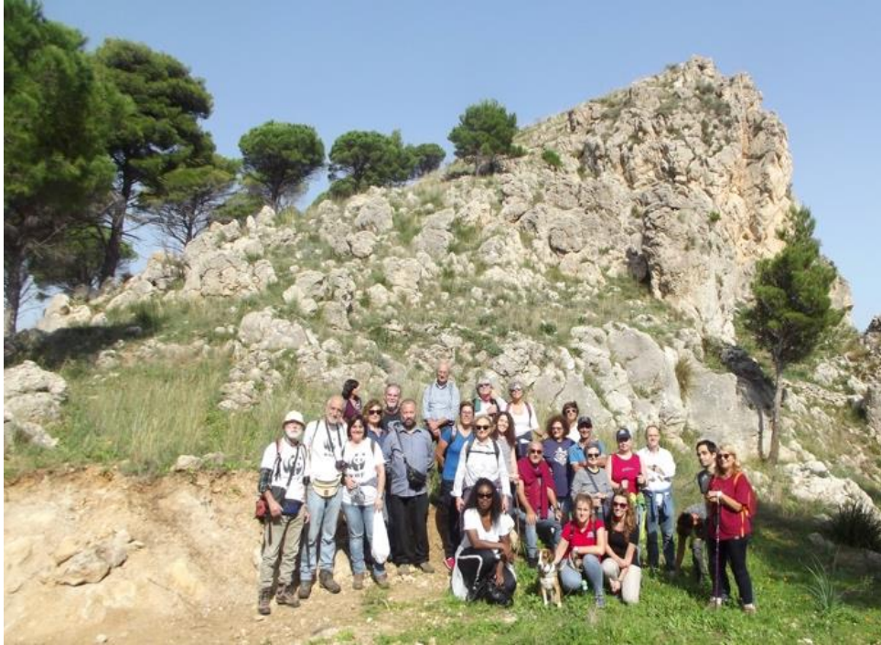
Foto ricordo alla base del Balzo Cavallo.