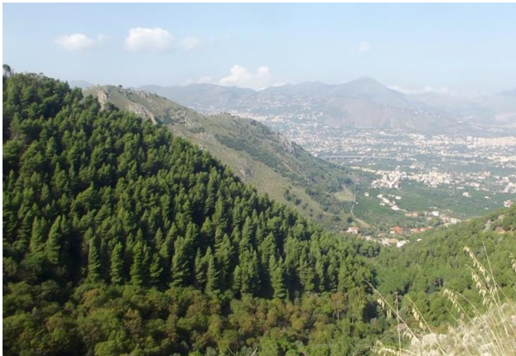
Uno scorcio panoramico con i rimboschimenti in primo piano.

Tornati alla Porta Palermo, iniziamo un facile percorso lungo la carrareccia che taglia appunto il versante montano, andando ad E fino a raggiungere la sella da cui si stacca il Balzo Cavallo. Quindi torniamo alla base dove ritroviamo gli automezzi forestali.