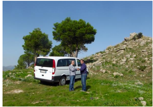
Porta Palermo: uno scorcio del panorama e i Forestali con uno dei pulmini.