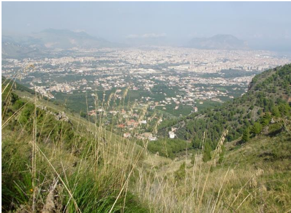
Panorama sulla Pianura di Palermo.

Al cancello d'ingresso, i doverosi saluti e ringraziamenti, quindi si procede per il ritorno al Parcheggio Basile.