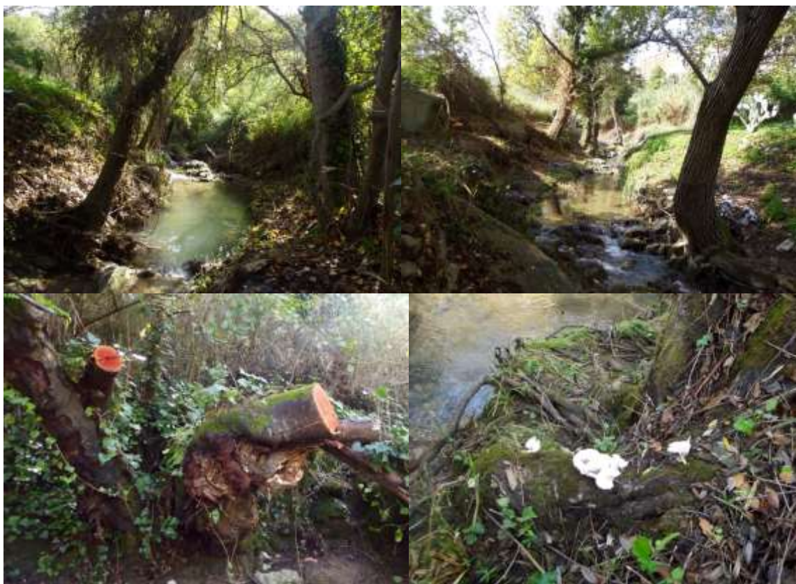
Il percorso lungo l'alveo attraversa suggestivi siti ombrosi e umidi.

Tel:091.303417 Fax: 091. 3809837 Email: sicilianordoccidentale@wwf.it Email: wwfsicilianordoccidentale@hotmail.com pec@pec.wwfsicilianordoccidentale.it Sito: www.wwfsicilianordoccidentale.it