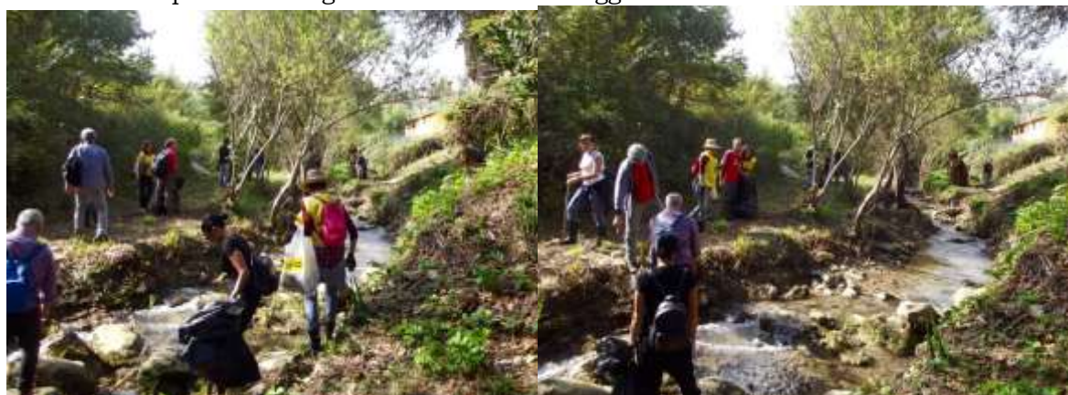
A tratti il percorso attraversa anche ameni siti del fondovalle. I grandi sacchi si riempiono presto di rifiuti di ogni tipo.

Lo scopo finale del WWF è fermare e far regredire il degrado dell'ambiente naturale del nostro pianeta e contribuire a costruire un futuro in cui l'umanità possa vivere in armonia con la natura.