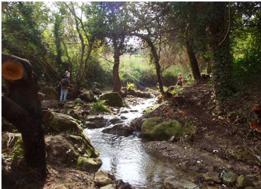
Il breve percorso verso la cascata.

Tel:091.303417 Fax: 091. 3809837 Email: sicilianordoccidentale@wwf.it Email: wwfsicilianordoccidentale@hotmail.com pec@pec.wwfsicilianordoccidentale.it Sito: www.wwfsicilianordoccidentale.it