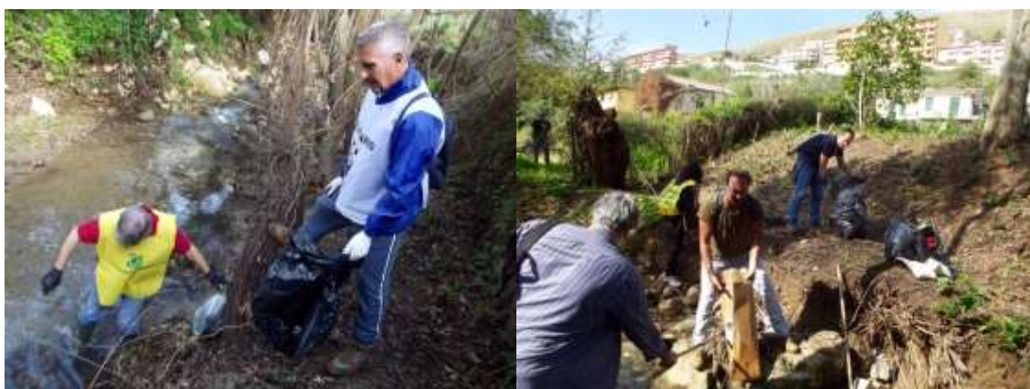
I sacchi sono stracolmi di rifiuti e si fatica a trasportarli