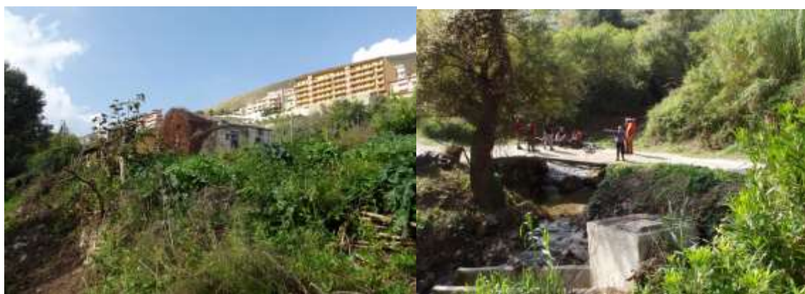
A sx, si osserva un vecchio mulino in abbandono. A dx si raggiunge il ponte stradale centrale di Pioppo. Qui termina l'attività di pulizia delle rive del fiume.