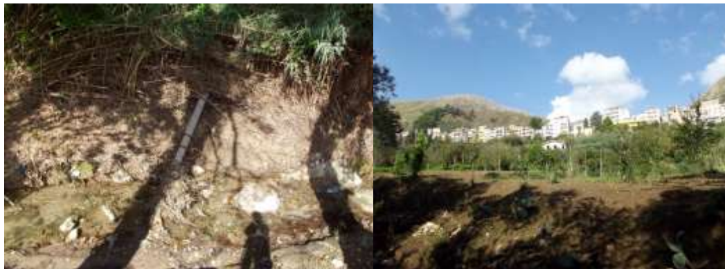
A sx, un palo di linea elettrica abbattuto rimane nell'alveo del fiume. A dx una vista del paese di Pioppo

Tel:091.303417 Fax: 091. 3809837 Email: sicilianordoccidentale@wwf.it Email: wwfsicilianordoccidentale@hotmail.com pec@pec.wwfsicilianordoccidentale.it Sito: www.wwfsicilianordoccidentale.it