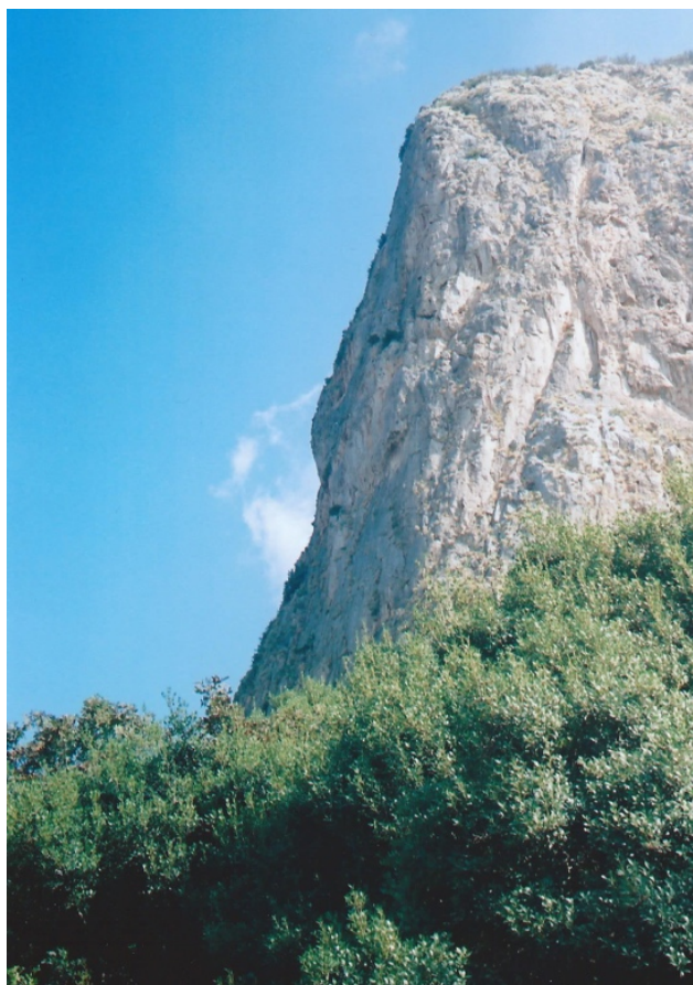
Monte Pellegrino. Roccia dello Schiavo

<<Monte Pellegrino non è solo la montagna sacra dei Palermitani ma è anche un museo geologico naturale. Attraverso la guida di Cipriano Di Maggio, docente di Geomorfologia dell'Università di Palermo, verranno osservate le rocce, i fossili e le morfologie presenti nel nostro monte, la cui lettura renderà possibile un tuffo nel passato lungo centinaia di milioni di anni, con la ricostruzione degli antichi ambienti in cui questi elementi si sono formati e modificati nel corso dei tempi geologici. La vista panoramica della Conca d'Oro e dei Monti Palermitani ci farà cogliere con immediatezza la differenza orografica fra la pianura e il sistema montuoso che la delimita, una differenza che è il risultato di una travagliata storia geologica sempre in divenire.>>