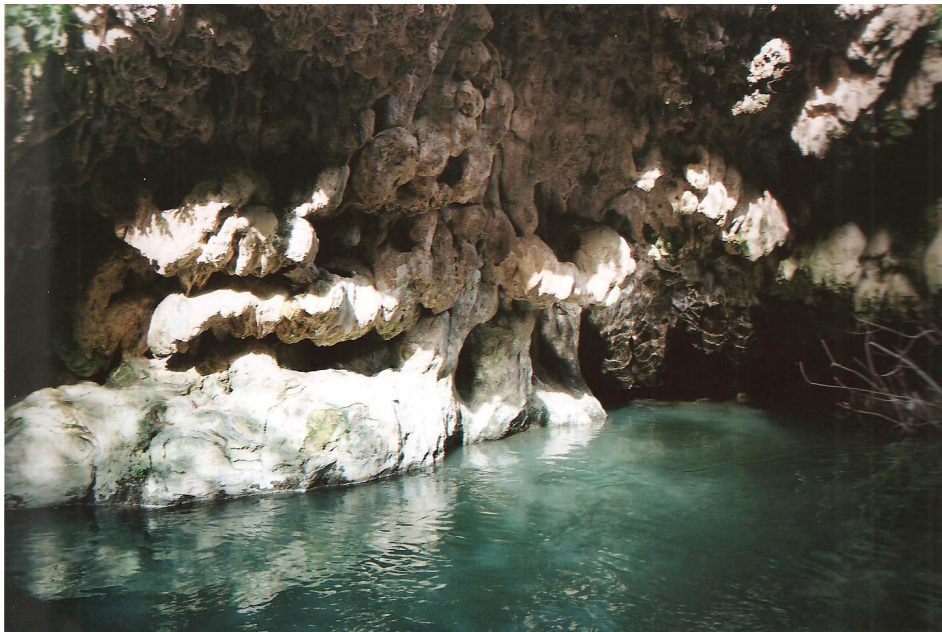
La risorgiva Fontana Lupo è "la dimora del dio Oreto"