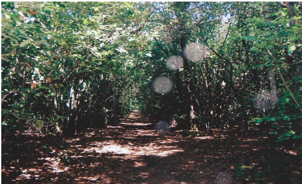
Parco della Favorita. Un viale del Bosco Niscemi