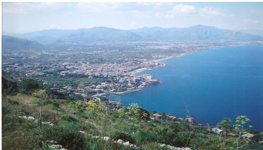
Il settore sud-orientale della Conca d'Oro, dal Monte d'Aspra

SABATO 1 OTTOBRE, ore 8:30 – durata: 2 ore