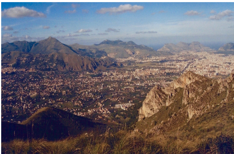
Panorama della Conca d'Oro, da Balzo Rosso

Sottotitolo comune a tutte le passeggiate: LA CONCA D'ORO DI PALERMO: UN TESORO DI AMBIENTE E CULTURA