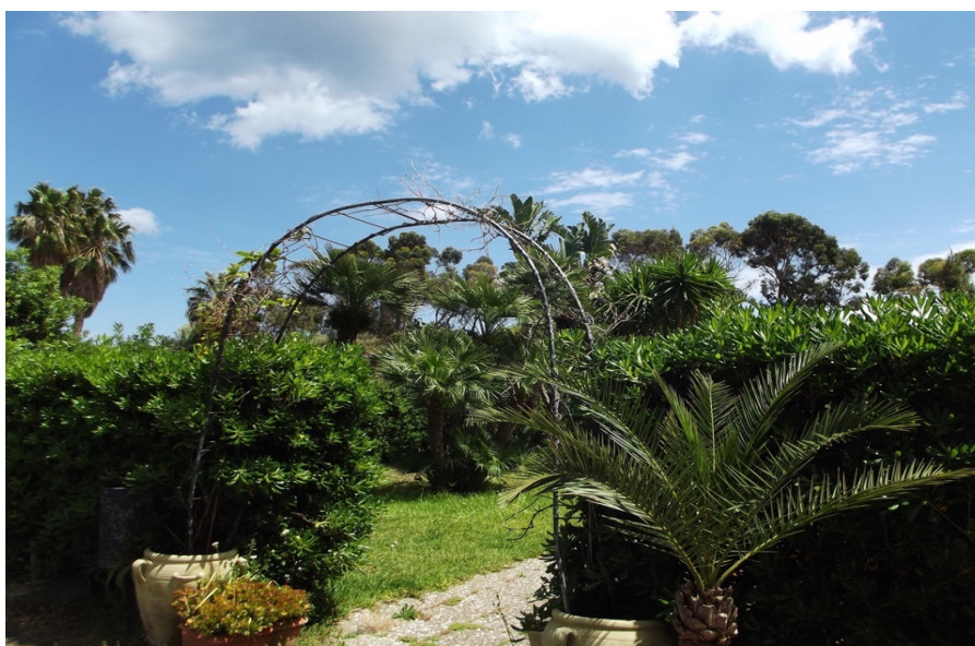
Il Giardino di Villa D'Amato, allo Sperone

I comitati civici palermitani e le associazioni ambientaliste auspicano che gli esempi di un facile ed economico risanamento ambientale possano estendersi all'intera costa compresa fra la foce dell'Oreto (Sant'Erasmus) e la foce dell'Eleuterio (Ficarazzi), dove termina, ad E, la Conca d'Oro, restituendo così alla costa la bellezza perduta e agli abitanti del popoloso quartiere un migliore livello di vivibilità.>>