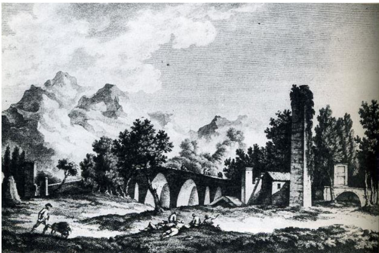
1. Incisione dal Voyage pittoresque ... di R. de Saint Non, 1785

Esempio insigne di ingegneria medievale il ponte, dalla forma a schiena d'asino, è in conci di tufo squadriati con sette arcate, a sesto acuto a ghiera rientranti, e cinque minori arcate intermedie, per diminuire la spinta dell'acqua sulla struttura.