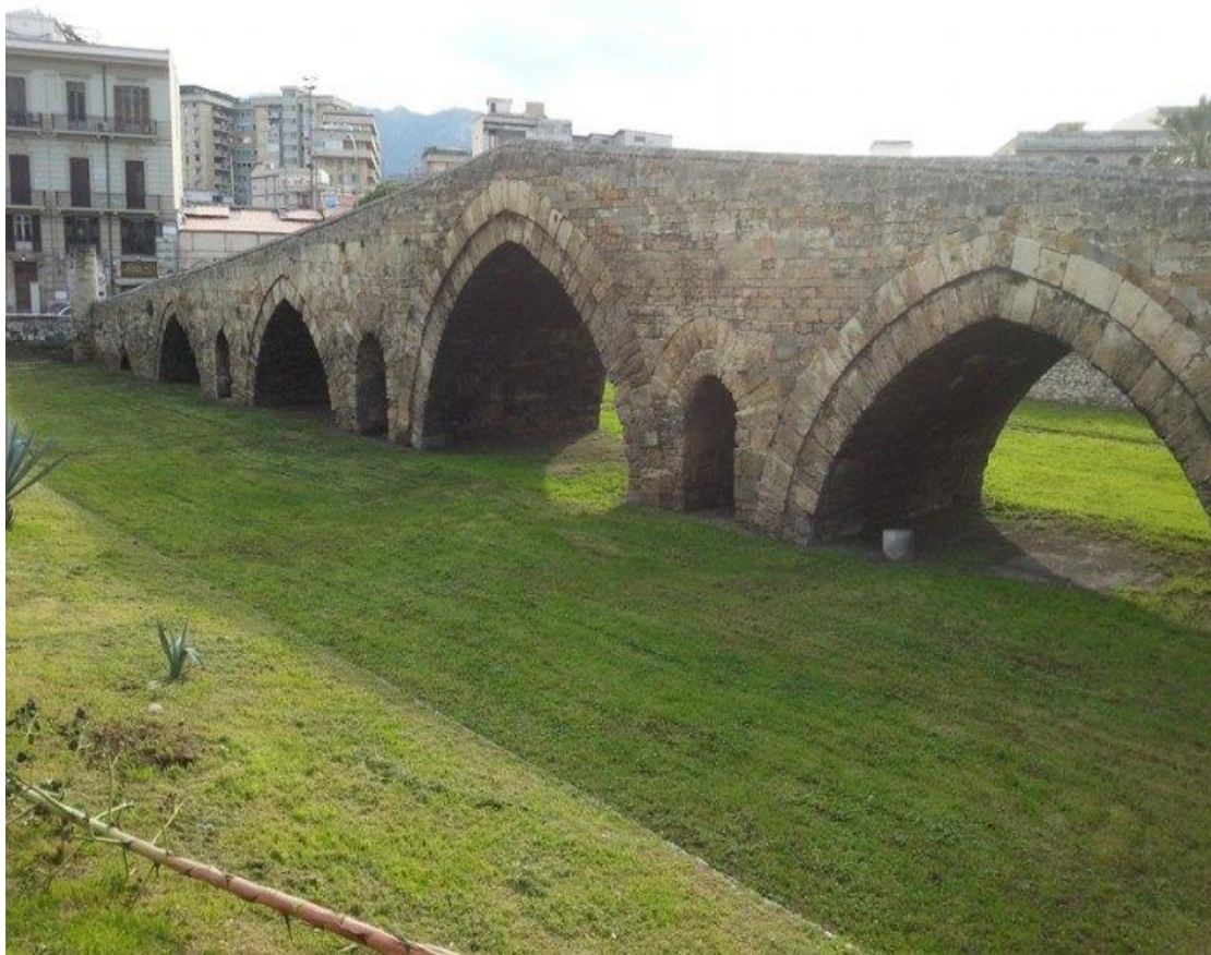
7. Il Ponte dell'Ammiraglio oggi