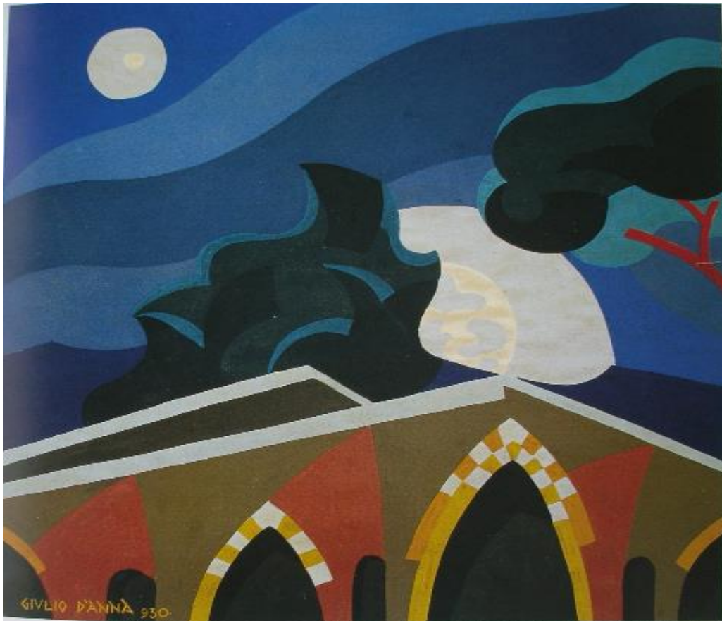
5. Giulio D'Anna, La luna sul Ponte dell'Ammiraglio , 1930

da molti decenni e che alludeva alla ricerca della libertà dei popoli, attraverso il linguaggio realista a cui il maestro rimase sempre fedele .