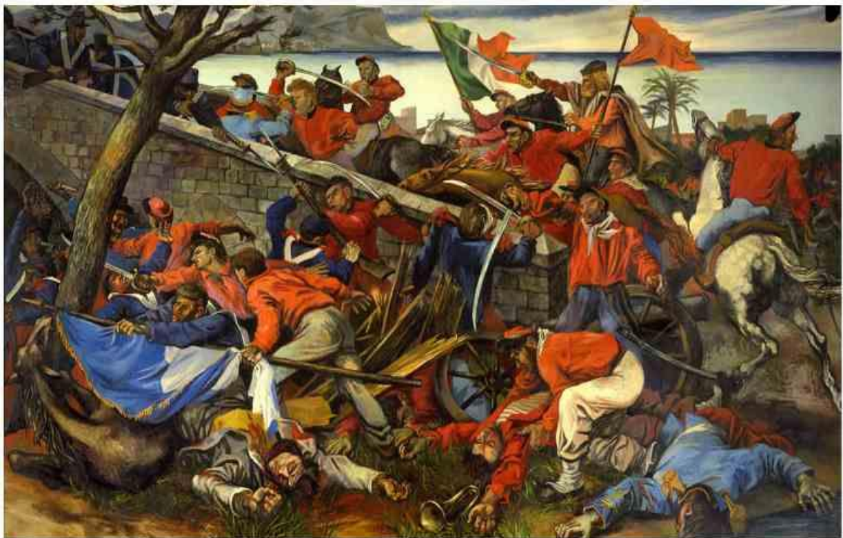
6. Renato Guttuso, La Battaglia del Ponte dell'Ammiraglio , 1952

da molti decenni e che alludeva alla ricerca della libertà dei popoli, attraverso il linguaggio realista a cui il maestro rimase sempre fedele .