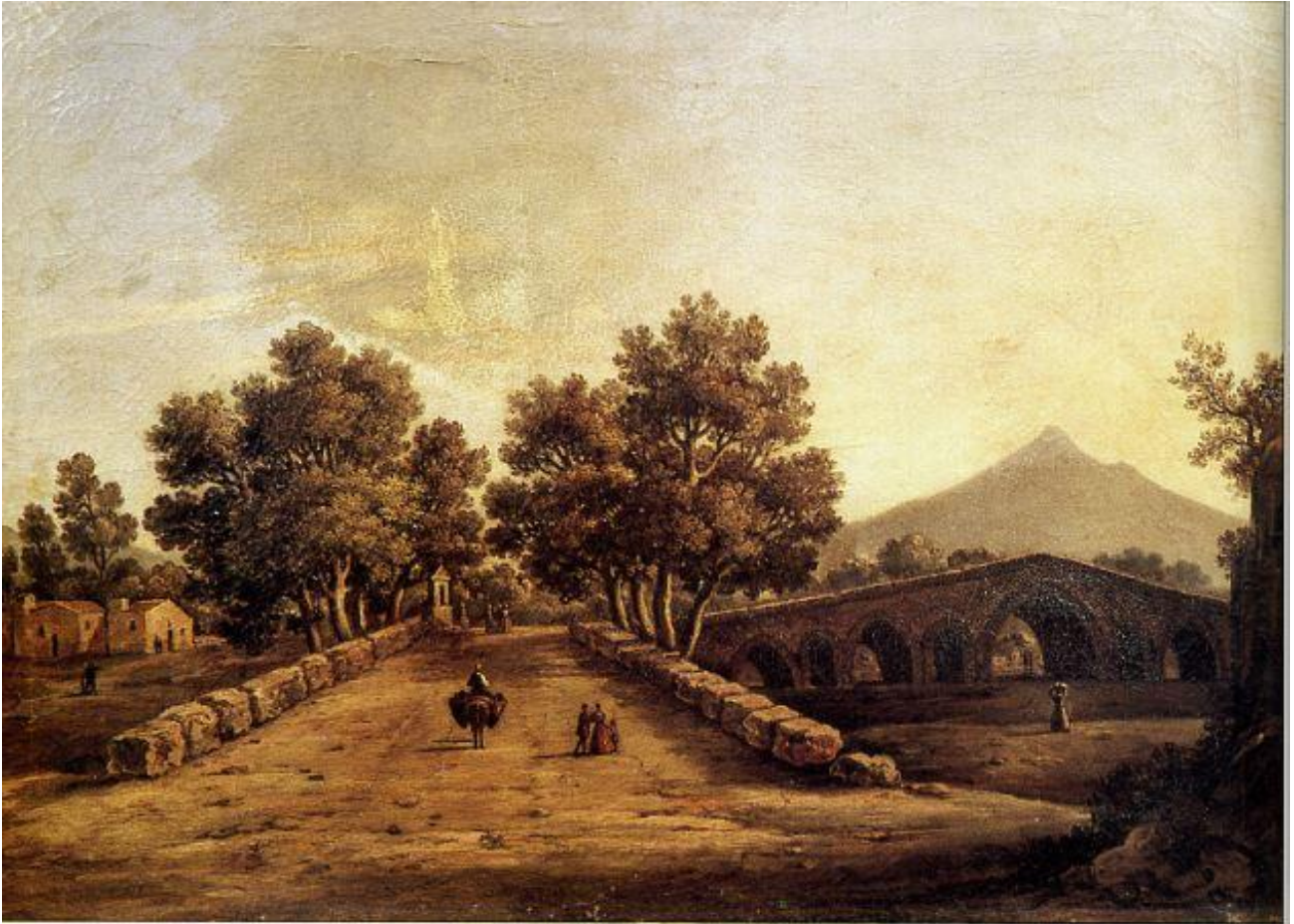
2. Dipinto dei primi del sec. XIX

In particolare nel sec. XVI la redditizia produzione dello zucchero portò ad estese piantagioni di canna da zucchero e nel contempo a massicci disboscamenti nei monti della Conca d'oro, per la necessità di legna necessaria ai procedimenti di cottura. Ciò costituì la causa prima che da quel momento determinò la serie delle disastrose inondazioni che provocarono danni al Ponte dell'Ammiraglio, ma anche all'intera città di Palermo.