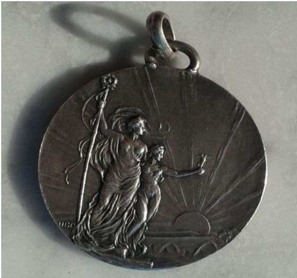
4. Antonio Ugo, Medaglia commemorativa dei 50 anni dell'Unità d'Italia, argento, 1910

Naturalmente tante incisioni, dipinti e sculture hanno interpretato il famoso scontro in opere coeve, ma anche nelle celebrazioni del cinquantennio nel 1910. A Palermo in due importanti monumenti è ricordato l'episodio garibaldino: il rilievo di Mario Rutelli nel basamento del monumento equestre a G. Garibaldi di Vincenzo Ragusa, del 1891, nel partérre omonimo in via Libertà, e il rilievo di Antonio Ugo nel monumento celebrativo dei cinquant'anni dell'unità nazionale, realizzato nel 1910 da Ernesto Basile, in conclusione della stessa via Libertà, la cosiddetta "statua". Entrambi i rilievi trattano il tema dello scontro armato, con il ponte visibile sullo sfondo, tuttavia mentre Rutelli si attiene al tempo storico vestendo i combattenti con le loro specifiche divise, Ugo trascende il dato temporale mostrando le figure ignude come in una mitica lotta.